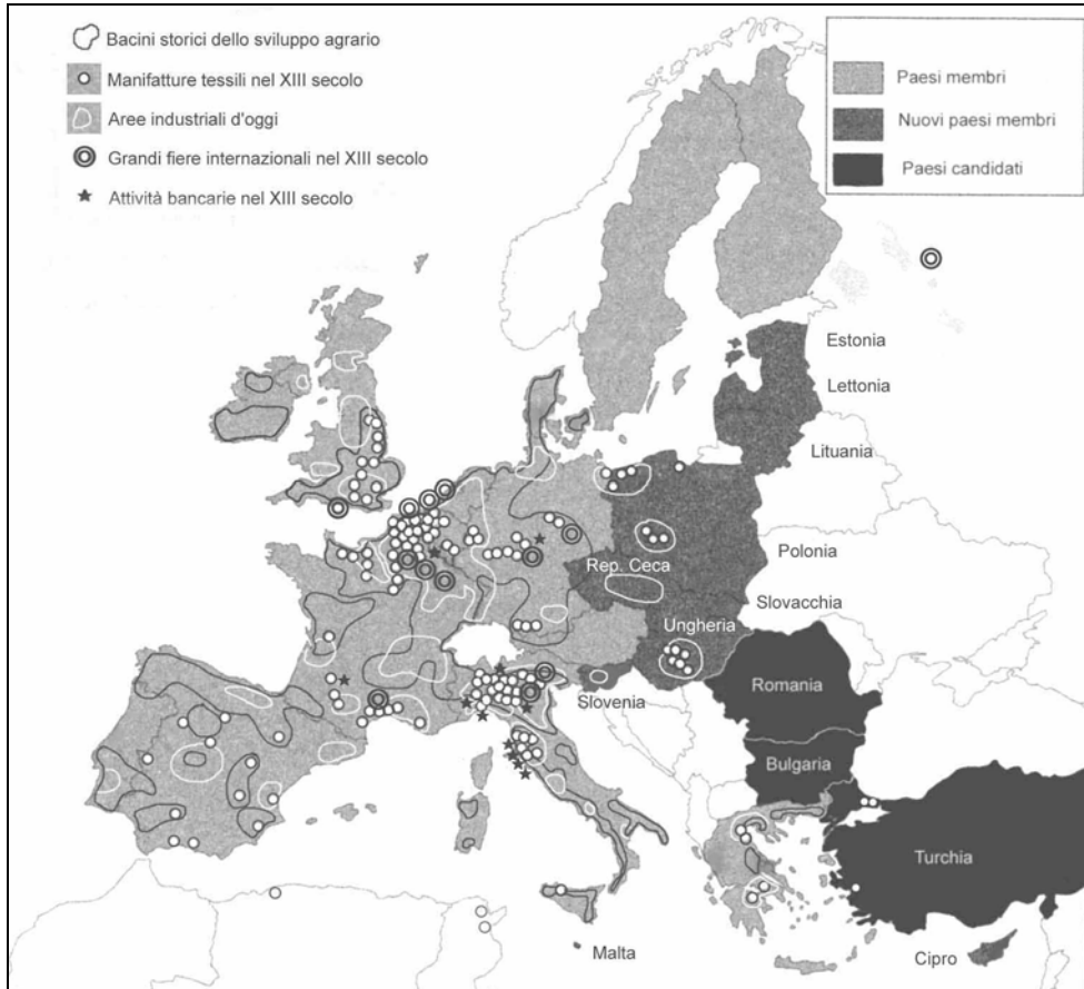
Figura 1. La cerniera "balcanica" e le grandi determinazioni geostoriche d'Europa sullo sfondo degli attuali confini fra paesi membri dell'UE, paesi candidati ed Eurasia (cartina nostra elaborata su dati da: Storia economica e sociale del mondo ; Atlante strategico ; Grande atlante storico del mondo , Limes).

fosse riuscito a riunire le sue forze – tagliate a metà al Brennero e a Venezia – e soprattutto se fosse riuscito a sottomettere la Germania al "suo" sistema economico, così com'era riuscito a sottomettere il Sud Italia.