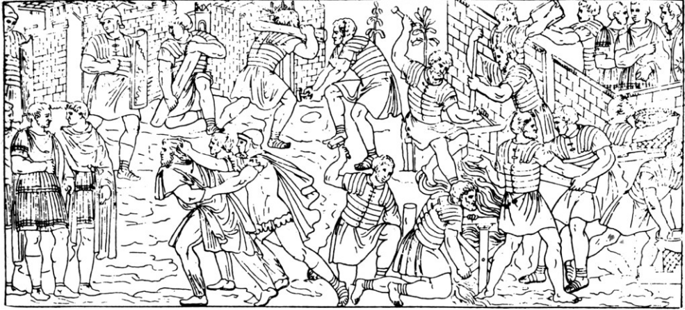
Roma, Colonna traiana. Soldati romani costruiscono il campo mentre un prigioniero viene condotto al cospetto dell'imperatore.